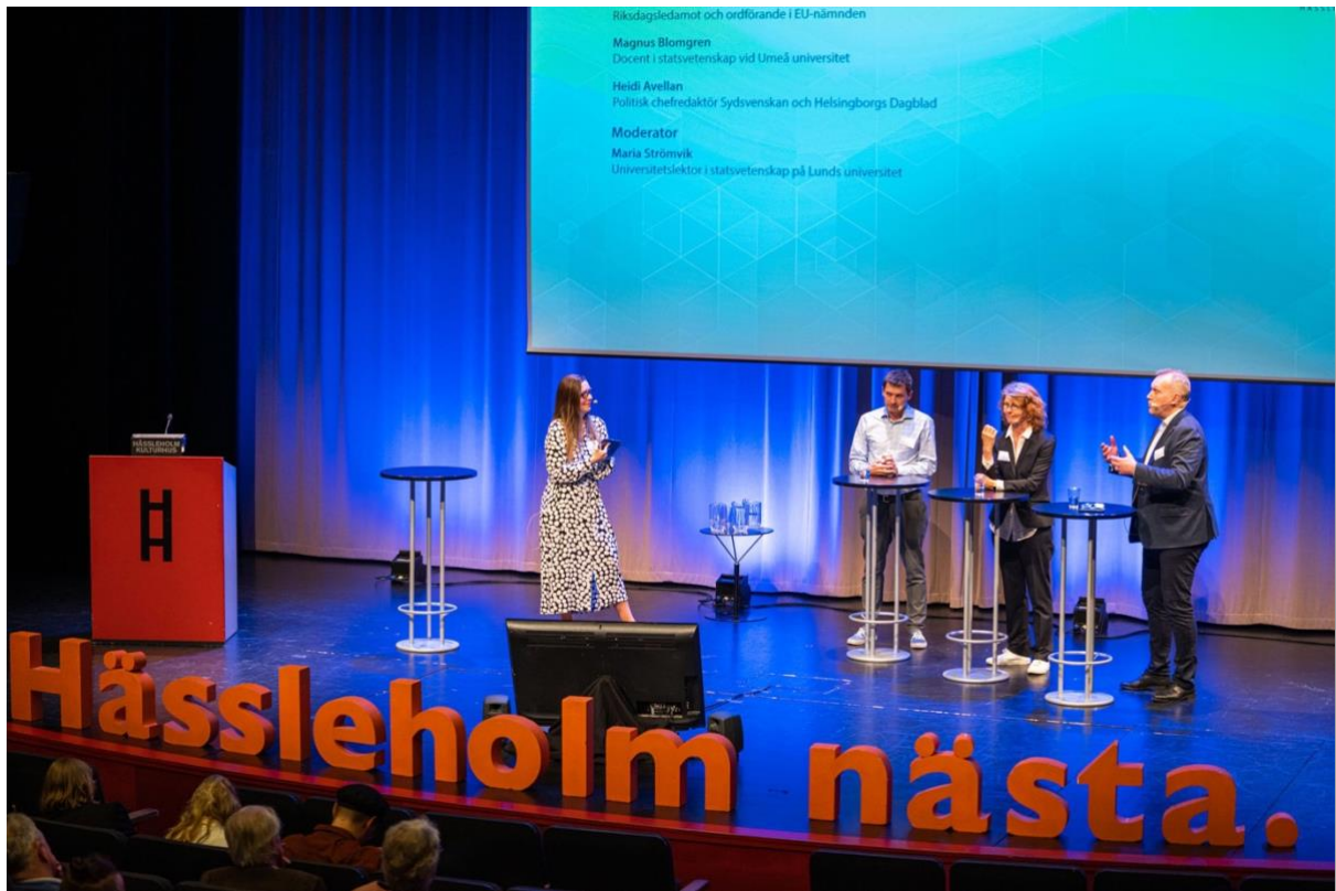
Samtal om EU i riksdagsvalet under Europaforum Hässleholm 2022.