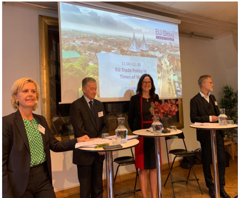
CFE organiserade samtal om global handel i krigstider under EU Days Lund