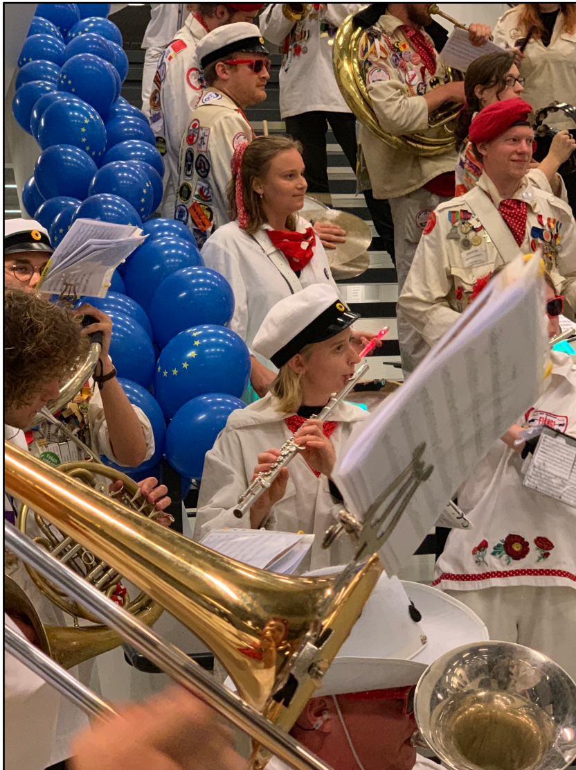
AMC Bleckhornen underhöll gästerna på CFE:s valvaka.

Studenterna blev också särskilt inbjudna till de forskarseminarier som arrangerades av CFE och de CFE-anknutna nätverken.