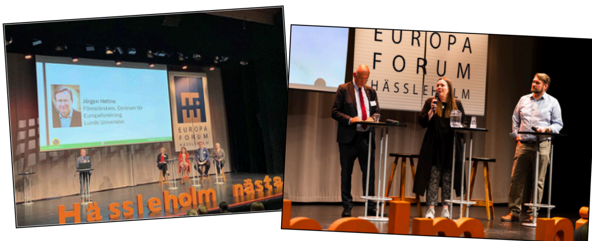
Europaforum Hässleholm maj 2019

CFE, tillsammans med representanter från de andra nordiska länderna, påbörjade även diskussioner om skapandet av en Nordic Association for European Studies (NAES).