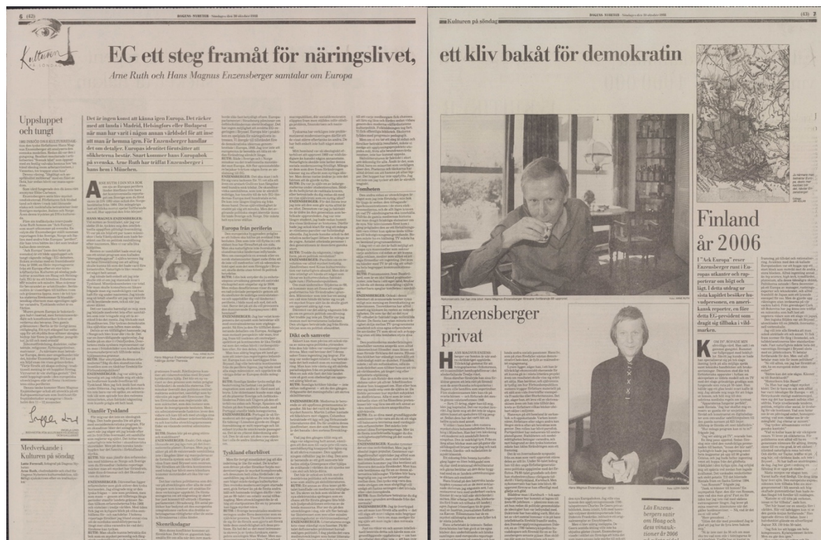
Figur 5 Dagens Nyheter:s läsare drabbades den 30 oktober 1988 av en Europachock. Enzensberger intervjuades av Arne Ruth och passager ur Ach Europa! blev dessutom översatta, som det syns till höger.

I söndagsbilagan upptog Europafrågorna sammanlagt tre helsidor. Utöver intervjun publicerades en presentation av Enzensberger och ytterligare två texter ur Ach Europa! , två framtidsscenarier; ”Finland 2006” och ”Ett par dammiga vinflaskor för 4000 000 $”. 238 Den förstnämnda utspelade sig 2006 och den andra samma år men med premissen att en kärnkraftsolycka hade ägt rum 1996 och därmed skapat inflation på ”antika” viner från tiden före katastrofen. I Finlandskapitlet ironiserade Enzensberger över den europeiska enhetsutopin. Texten gestaltade ett möte mellan ett textjag – en brittisk journalist – och en före detta EG-president som avlägsnat sig från stadslivet. Presidenten envisades i samtalet med att avsikten med europatanken var ”att bygga upp ett stort block som motvikt mot de andra blocken” men, men medgav att Bryssel tyvärr utvecklats till en ”jättelik, övernationell vattenskalle” som förr eller senare skulle försätta Europa i konkurs. Det EG-projekt som hade