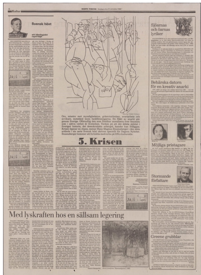
Figur 2 Hans Magnus Enzensberger femte och sista reportage ur Svensk höst publicerades 21 november. Samtliga reportage blev illustrerade av den svenska konstnären Tommy Östmar.

Enzensbergers fortsatta närvaro på Dagens Nyheter utgjorde dels av sporadiskt publicerade essäer, dels ytterligare två europeareportage (och ytterligare ett som kommer presenteras i det fjärde och sista analyskapitlet) som publicerades 1984: Italienska irrfärder och Norska anakronismer , i vilka Enzensberger öppnade blicken mot andra delar av Europa. Dessa europeareportage var ursprungligen skrivna och publicerade på uppdrag av den italienska dagstidningen L'Espresso respektive det norska förlaget Universitetsforlaget , men översattes av Gustafsson och publicerades på Dagens Nyheter . 146 Italienska irrfärder liknade till formen Svensk höst ; artikelserien bestod av sex längre essäer som publicerades inom två